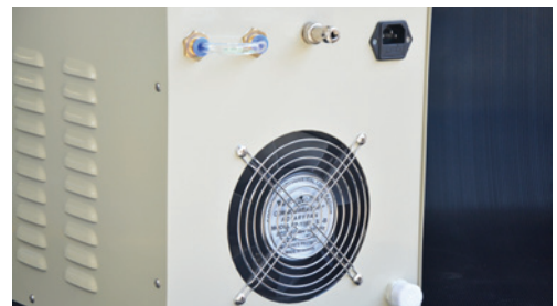
Einfach anzuschließen Simple plug and play