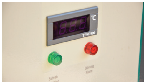
LCD-Display und LEDs LCD Display and LEDs