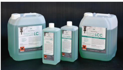
Kühlmittel passend erhältlich Suitable cooling liquid available