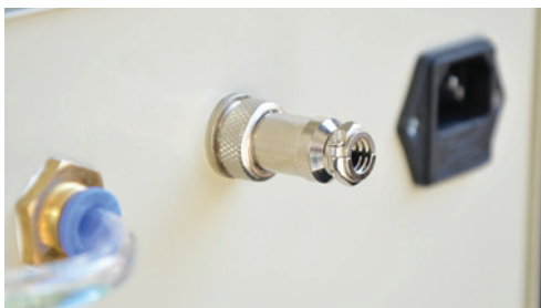
Ausgang Signalleitung Output Signal cable